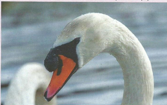
Protéger les oiseaux, c'est l'un des objectifs de Gorna (document remis)

d'un animal en détresse et de la réglementation pour les espèces protégées. Elle s'occupe également de la surveillance épidémiologique et sanitaire de la faune et d'actions de sensibilisation auprès de la population.